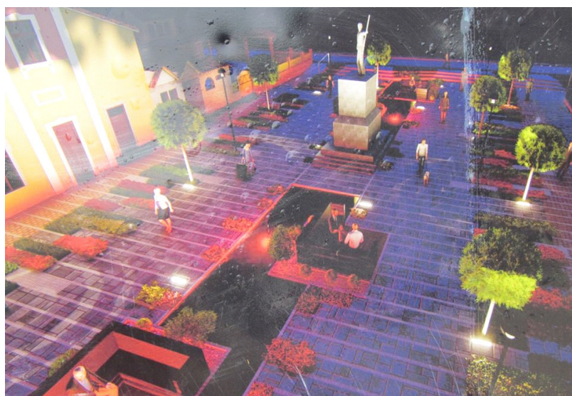
Градски трг данас, 2019. година