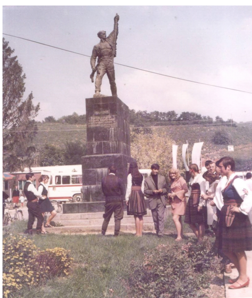
Градски трг, 2000. година